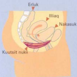
Kuutsit nukii sukaqqasut