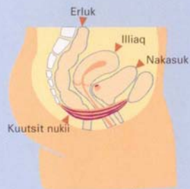
Kuutsit nukii qasukkaqqasut

Nukiit katersuussimasut pingaartumik takisoorujussuannngortartut sanngiillisartullu ilagaat nukiit nalikkaaniittut.