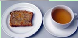
Mellem 1100 kJ