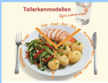
www.mad-paa-arbejde.dk → materialer → 07-10-2004 dækkeserviet 4