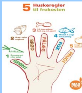
www.mad-paa-arbejde.dk → materialer → 25-11-2004