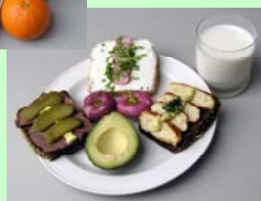
Frokost 2800 kJ