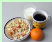
Morgen 1900 kJ