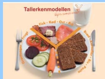
www.mad-paa-arbejde.dk → materialer → 07-10-2004 dækkeserviet 3