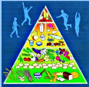
CINDI Dietary Guide www.EURO.WHO.int/document/E70041.pdf