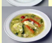
Aften 3000 kJ