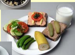
Frokost 3200 kJ