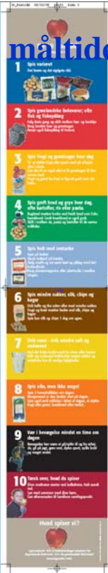
www.paarissa.gr → Indsatsområder → kost og fysisk aktivitet