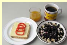
Morgen 2300 kJ